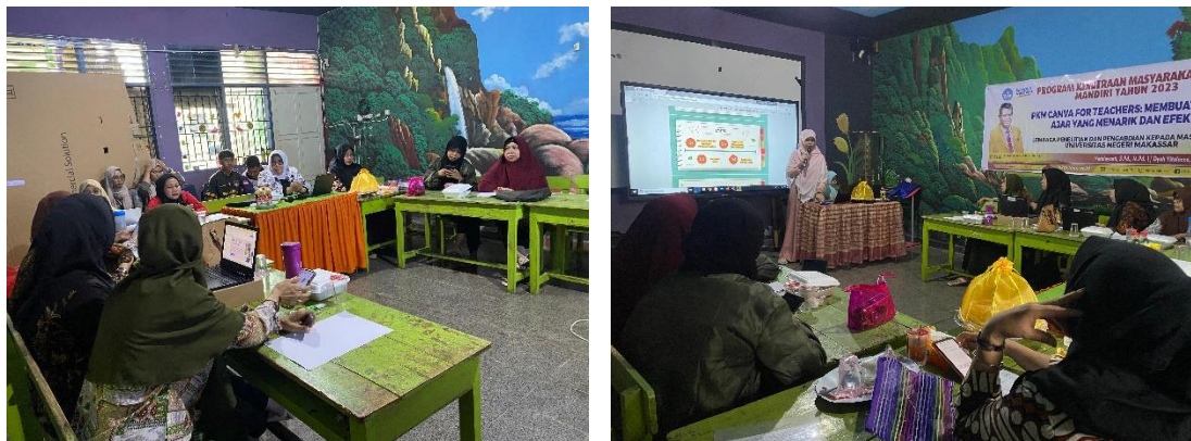
Gambar 3. Pemberian Materi

Pelaksanaan pelatihan dimulai dengan suatu pemaparan yang mendalam mengenai urgensi penggunaan media yang menarik dalam konteks pembelajaran siswa. Fokus utama adalah membahas bagaimana aplikasi Canva dapat menjadi alat yang sangat berharga dalam menciptakan materi ajar yang menarik dan efektif. Guru-guru diajak untuk mengenal lebih dekat aplikasi ini serta dipandu langkah demi langkah dalam penerapannya, terutama dalam pembuatan presentasi yang menjadi bagian integral dari proses pembelajaran.