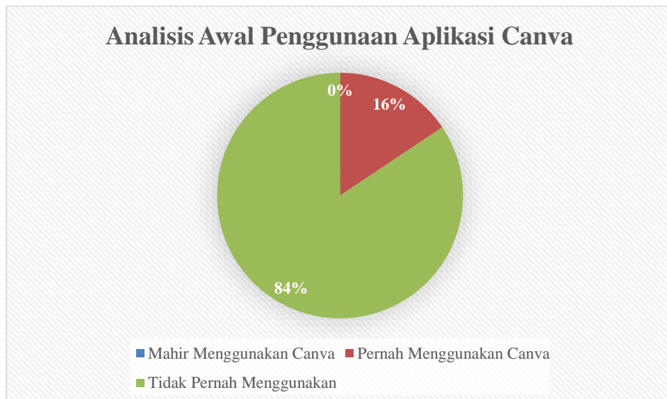
Gambar 2. Analisis Awal Penggunaan Aplikasi Canva dalam Membuat Bahan Pembelajaran

Tahap analisis ini dimulai dengan pelaksanaan di sekolah mitra, yaitu SD Inpres Bonto-Bontoa, setelah mendapatkan persetujuan dari kepala sekolah terkait kegiatan analisis di sekolah tersebut. Hasil analisis mendapatkan gambaran bahwa dari total 32 guru di sekolah tersebut, hanya 5 orang di antaranya pernah menggunakan aplikasi Canva untuk membuat media pembelajaran. Penggunaan aplikasi ini cenderung terbatas pada pembuatan slide presentasi. Menariknya, sebanyak 27 guru lainnya belum pernah menggunakan aplikasi Canva dan bahkan belum mengetahui keberadaan Canva for Education, yang merupakan versi gratis khusus untuk guru. Hal ini mencerminkan tingkat keterbatasan pemahaman dan pemanfaatan aplikasi tersebut di kalangan staf pengajar di SD Inpres Bonto-Bontoa.