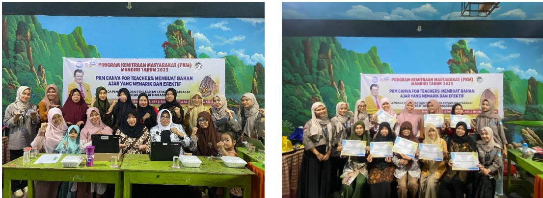
Gambar 4. Foto bersama dan Penyerahan Sertifikat

hanya mendapatkan pengetahuan dan keterampilan baru, tetapi juga mampu menciptakan pengalaman pembelajaran yang lebih interaktif dan memikat bagi siswa.