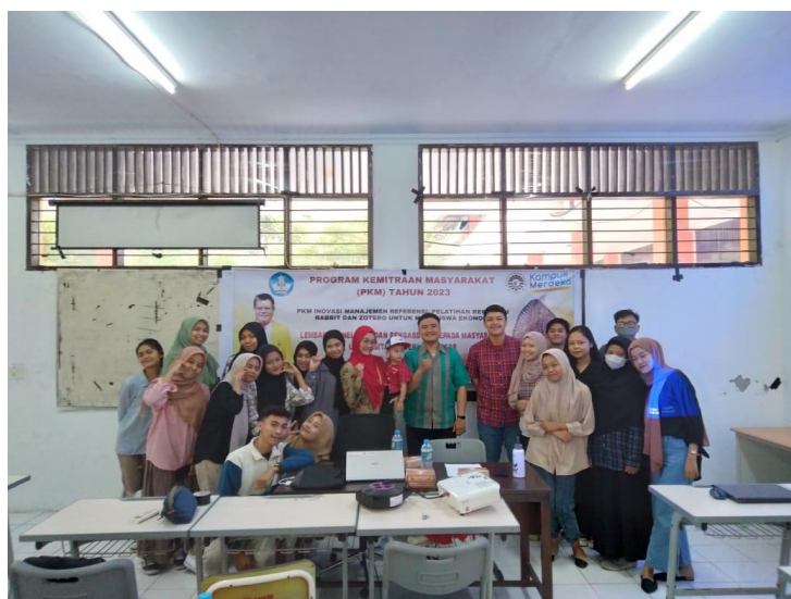
Gambar 6. Penutup Materi