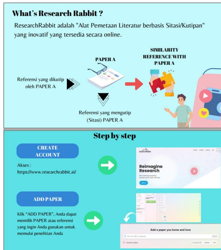
Gambar 2. Materi Inti Pelatihan Researchrabbit