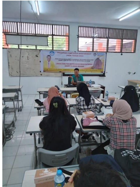
Gambar 4. Penjelasan Pendahuluan Materi

Setelah materi pelatihan tersusun dengan baik, tahap selanjutnya adalah pelaksanaan sesi pelatihan. Jadwal pelatihan dirancang dengan memadukan sesi teori dan praktik, memberikan pengantar yang solid mengenai konsep manajemen referensi dan kegunaan Rabbit dan Zotero dalam penelitian ekonomi. Sesi interaktif, termasuk demonstrasi langkah-demi-langkah dan latihan praktis, memberikan peserta kesempatan untuk langsung menerapkan pengetahuan yang mereka peroleh. Pendekatan ini diambil untuk memastikan bahwa peserta tidak hanya memahami teori, tetapi juga mampu mengimplementasikannya dengan percaya diri dalam konteks penelitian ekonomi.