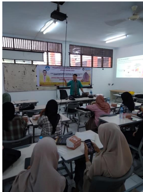
Gambar 5. Penjelasan Materi Inti